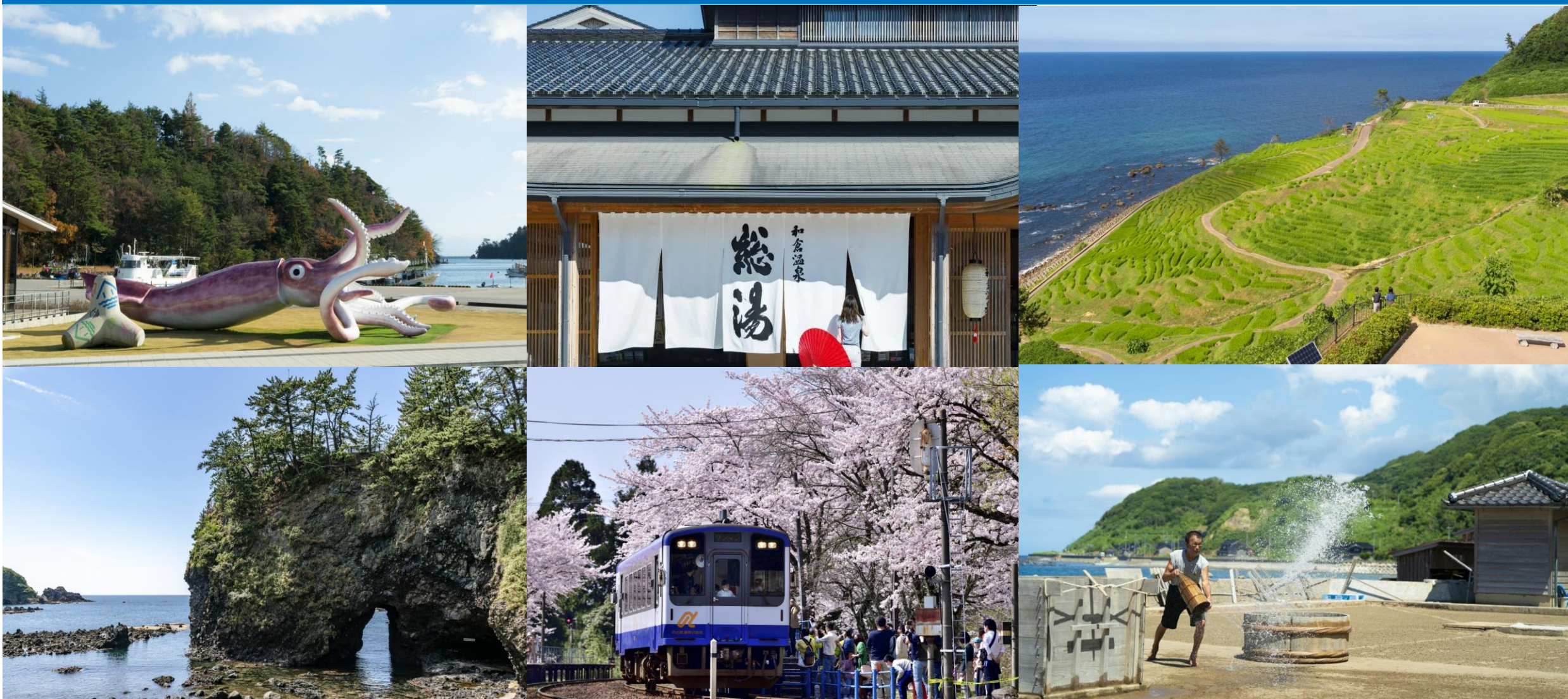
左上部：イカの駅 つくモール（能登町） 右上部：和倉温泉総湯（七尾市） 左中部：白米千枚田（輪島市） 右中部：巖門（志賀町） 左下部：能登さくら駅（穴水町） 右下部：揚げ浜塩田（珠洲市）