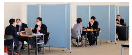
だいしんビジネスマッチング商談会2023

・2023年11月2日にはだいしんホールにて8社の大手バイヤーに自社商品を提案する「だいしんビジネスマッチング商談会2023」を開催しました。27社のお客さまに参加いただき、合計64商談を行いました。