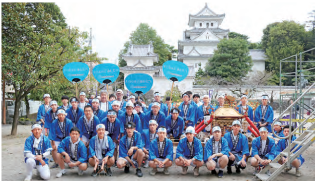
大垣十万石まつり