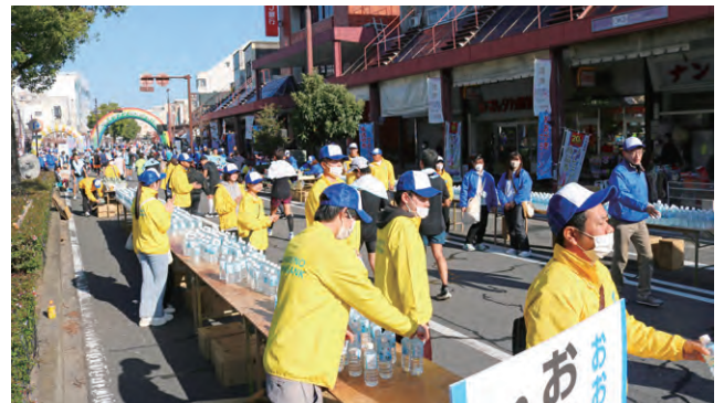
おおがきマラソン2023ボランティア参加