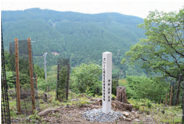
池田山広葉樹植栽事業への寄贈