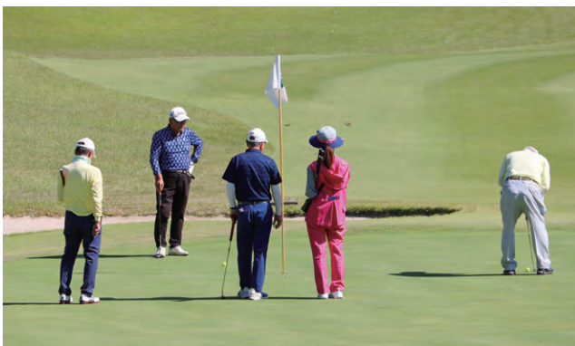
2023年10月18日 第49回大垣西濃信用金庫杯親睦ゴルフ大会