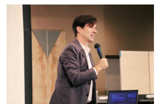
文化講演会 講師：パッキンマックン 2023年11月1日

今年は、「パッキンマックンの笑撃的国際交流」と題して、講師にパッキンマックンをお招きし、250名のご参加をいただきました。