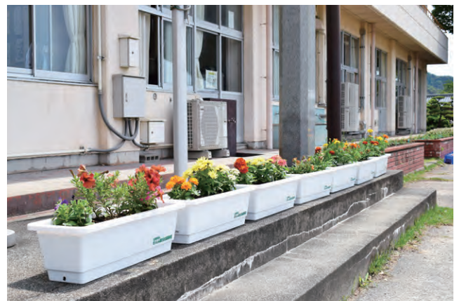
揖斐川町の小学校への花苗入りプランター寄贈