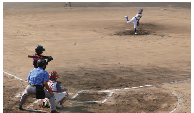
2023年11月4日 大垣西濃信用金庫理事長旗野球大会決勝戦 瑞穂本巣大会