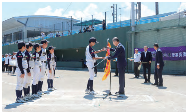
2023年8月20日 大垣西濃信用金庫理事長旗野球大会決勝戦 揖斐郡大会