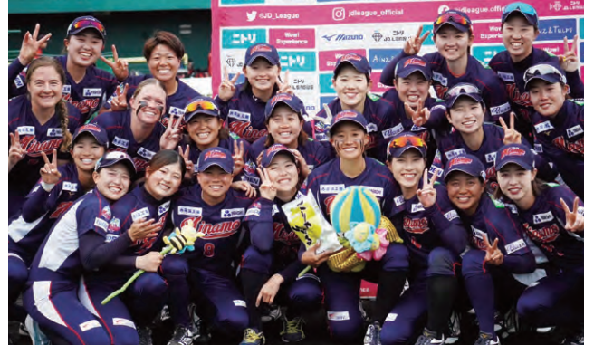
クラブビジョン“地域に愛され、みんなも元気”