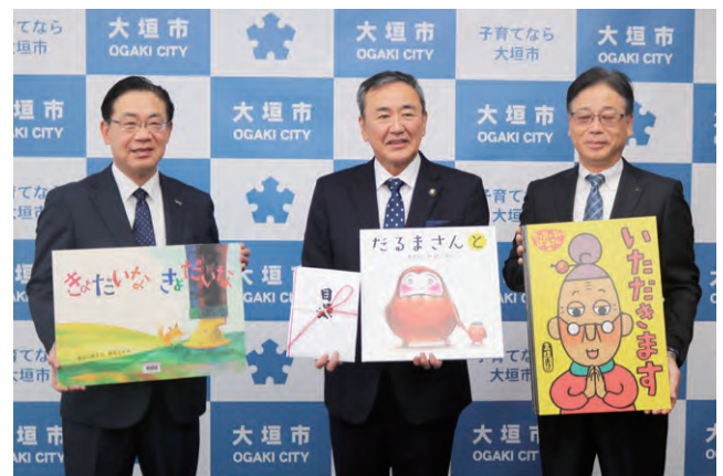
大垣市大型絵本寄贈