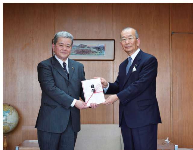
第49回長良天神書初め書道展助成