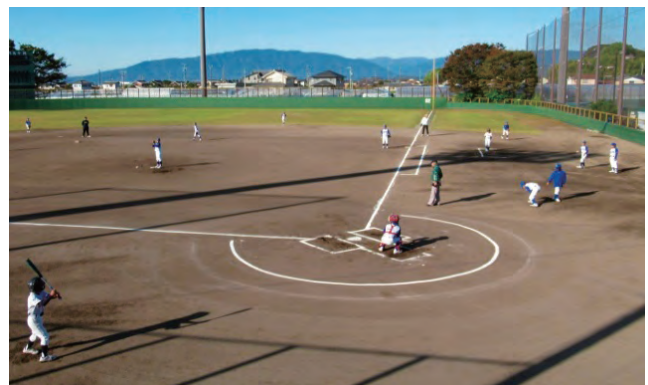
2020年10月31日 大垣西濃信用金庫理事長旗野球大会決勝戦 瑞穂本巣大会