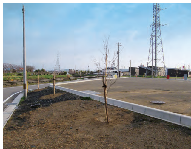
北方町 樹木等寄贈