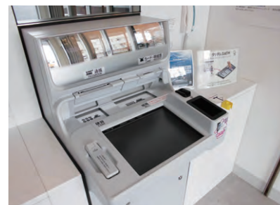
笠縫支店 店内ATMコーナー(タッチレスATM)

ATMコーナーにおいては不特定多数の利用者が触れるなど接触感染リスクが高いため、抗菌・抗ウイルスコーティング剤を塗布しました。インフルエンザウイルスが約5分で不活性化するほか、防カビの効果も認められています。抗菌・抗ウイルス作用が5年ほど持続する点も評価して全面導入いたしました。また、笠縫支店において、岐阜県下の信用金庫で初めて、画面に触れずお取引ができる「タッチレスATM」を導入いたしました。空中に浮いている画像のボタンを押すことで、画面に触れることなくATMの操作をすることができます。