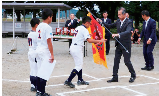
2020年9月26日 大垣西濃信用金庫理事長旗野球大会決勝戦 揖斐郡大会