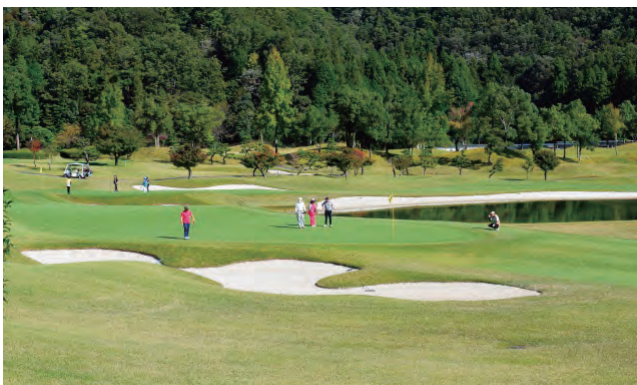
2020年10月21日 第46回大垣西濃信用金庫杯親睦ゴルフ大会