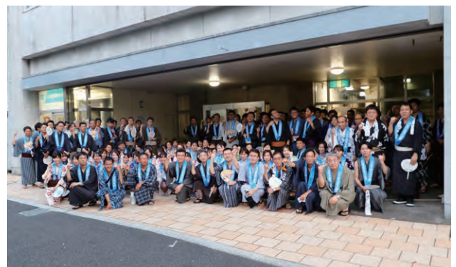
水都まつり大垣おどり大会

・西濃綱引選手権大会、水都まつり大垣おどり大会、十万石まつり、いびがわマラソン2019 ボランティア参加、おおがきマラソン2019 ボランティア参加、各地域の商工祭他