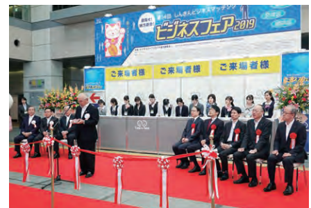
しんきんビジネスフェア