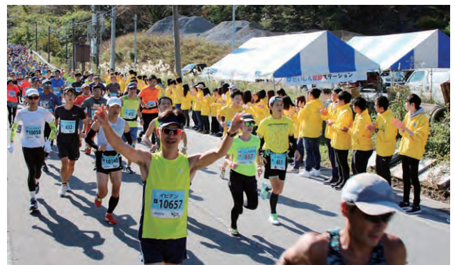
いびがわマラソン2019 ボランティア参加