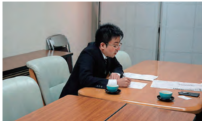
「遺言の日」無料法律相談会