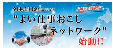
よい仕事おこしネットワーク