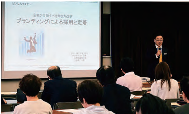
だいしんセミナー