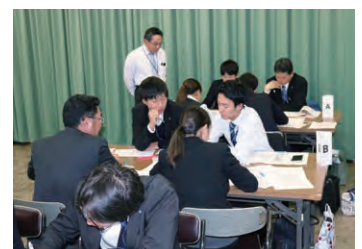
目利きマスター研修

外部派遣研修への参加及び通信講座の受講を積極的に奨励するとともに、SD(自己啓発)セミナー【営業店職員から要望の多い講座を、本部担当部の職員が講師となり行う自主勉強会】を定期的で開催し、職員の課題解決のための能力向上に努めました。