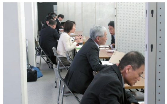
ワンストップ経営相談会

平成30年9月、大垣商工会議所主催の創業塾に当金庫職員を講師として派遣しました。