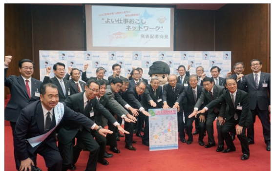
よい仕事おこしネットワーク