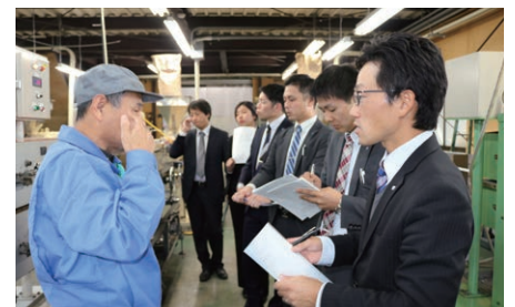
目利きマスター研修

外部派遣研修への参加及び通信講座の受講を積極的に奨励するとともに、SD(自己啓発)セミナー【営業店職員から要望の多い講座を、本部担当部の職員が講師となり行う自主勉強会】を定期的で開催し、職員の課題解決のための能力向上に努めました。