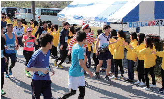
いびがわマラソン

大垣市環境市民フェスティバル、大垣まつりグリーン作戦、水都まつり大垣おどり大会、十万石まつり、「いびがわマラソン2018」ボランティア参加、「おおがきマラソン2018」ボランティア、各地域の商工祭他