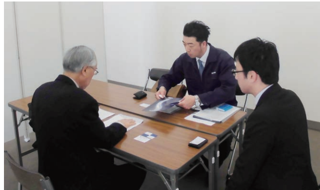
シニア人材交流会