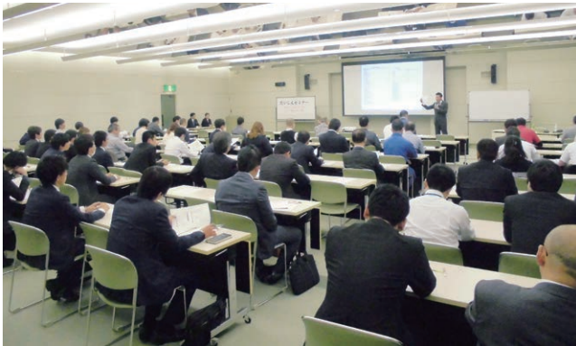
だいしんセミナー